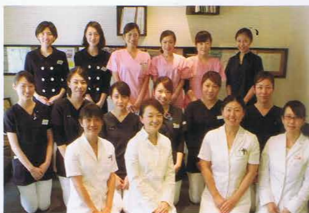
おおくぼ歯科クリニックの皆さま

ダイレクトボンディングの患者さま向け資料。この資料を待合室に置くことで、「この治療をしてください。」と患者さまから言われることが多いそうです。