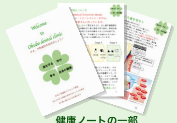
健康ノートの一部

この健康ノートにはあなた自身の事を知るためのツールや情報がたくさん詰まっています。ぜひ一緒に考え、あなただけの世界にたった1つのノートを作り上げていきましょう。